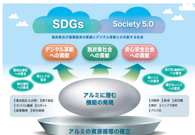
アルミニウムが目指す2050年の世界

アルミは古くて新しい素材ですが、最近水素吸蔵合金にアルミが使えるということも分かってきています。新しい時代にあっても、イノベーションを推し進め、アルミがより良くより多く使われ、社会に貢献できればと考えています。